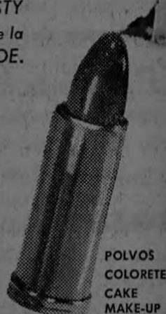
POLVOS COLORETES CAKE MAKE-UP

Otros matices Tangee: Rojo-Fuego, Gay-Red, Medium-Red, Theatrical y Natural.