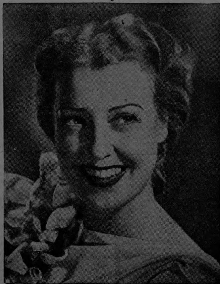
JEANETTE MAC DONALD, Estrella de la Metro Goldwyn Mayer.

Aunque Jeanette MacDonald pensaba dedicarse por completo a la ópera y conciertos cuando abandonó Hollywood hace cinco años, los atractivos de un argumento que llegó a sus manos doblegaron su voluntad.